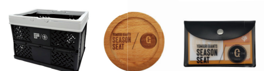
ジャイアンツ オリジナルグッズ(例)